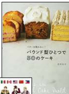
パウンド型ひとつで 5種類のケーキ