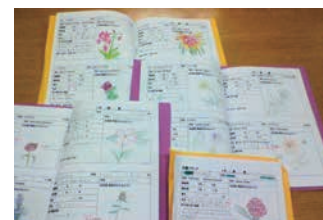
生徒がそれぞれ作る「花調べカード」。草花の名前、スケッチ、草丈、花の色が記入され、まるで二植物図鑑!

約20種類の一年草の中から花の色、草丈を考え、組み合わせたいのはまるでパズルのようです。すんなり決まることはまずありません。「色はいいけど、草丈が合わなくて前後がかぶっちゃう」「〇〇ちゃんの花調べカード、ちょっと見せて。あつ、その図鑑も見たい!」みんな、自分がイメージする花壇をデザインするの