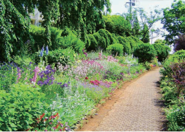
実際の境界花壇。生徒はこのような花壇を想像しながら設計していく

恵泉でなぜ「花壇設計」、それも少し難しい境界花壇の設計を行うのでしょうか。20年以上授業を担当する中で、「さまざまな個性の組み合わせによって世の中が作られ、ひとつひとつの個性は異なった美しさと役割を果たしている」ことを実感するためなのかな、と思うようになりました。中1の入学時に「年の数だけ花の名前を覚えよう!」を目標に植物との付き合いが始まり、必修として最後の履修である高1では、植物の世界を通して人の社会を考える。恵