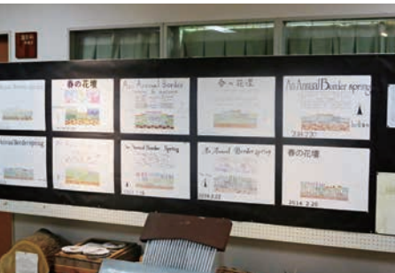
園芸教室には、「メディアスペース」という展示コーナーがあり、教材、農具について年間を通して展示している。展示の中で最も目を引くのがこの生徒が描いた「花壇設計」のデザイン図だ