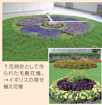
↑花時計として作られた毛氈花壇。→イギリスの寄せ植え花壇

立体花壇 …草丈の違う植物を組み合わせた花壇。壇花壇と、芝生やロータリーなど、四方から眺められるように中央に高いもの、周囲に低いものを組み合わせた寄せ植え花壇があります。